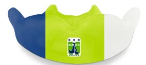
Club logo, + € 5,-