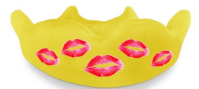
Pimpen, + € 12,50